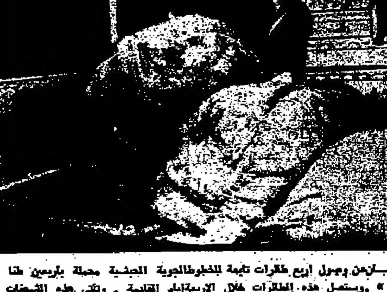
اعلان السفارة الامريكية في عمان

عمان - يصل الى عمان في الرابع والعشرين من الشهر الحالي وفد من اساتذة الجامعات الامريكية لزيارة الاردن استغرق بضعة ايام يطلع خلالها على احوال القرايين في المؤسسات التعليمية وتبادل كبار المسؤولين للتعليم على وجه النظر العربية من قضية فلسطين واقتصاديا العربية الاخرى .